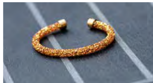
ARMBAND: Swarovski € 69