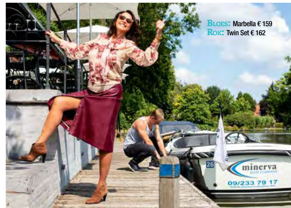
BLOES: Marbella € 159 ROK: Twin Set € 162