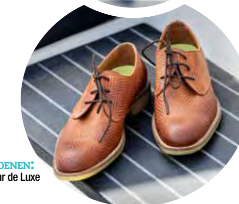
SCHOENEN: Cycleur de Luxe € 145