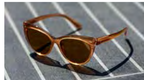
ZONNEBRIL: Swarovski € 150