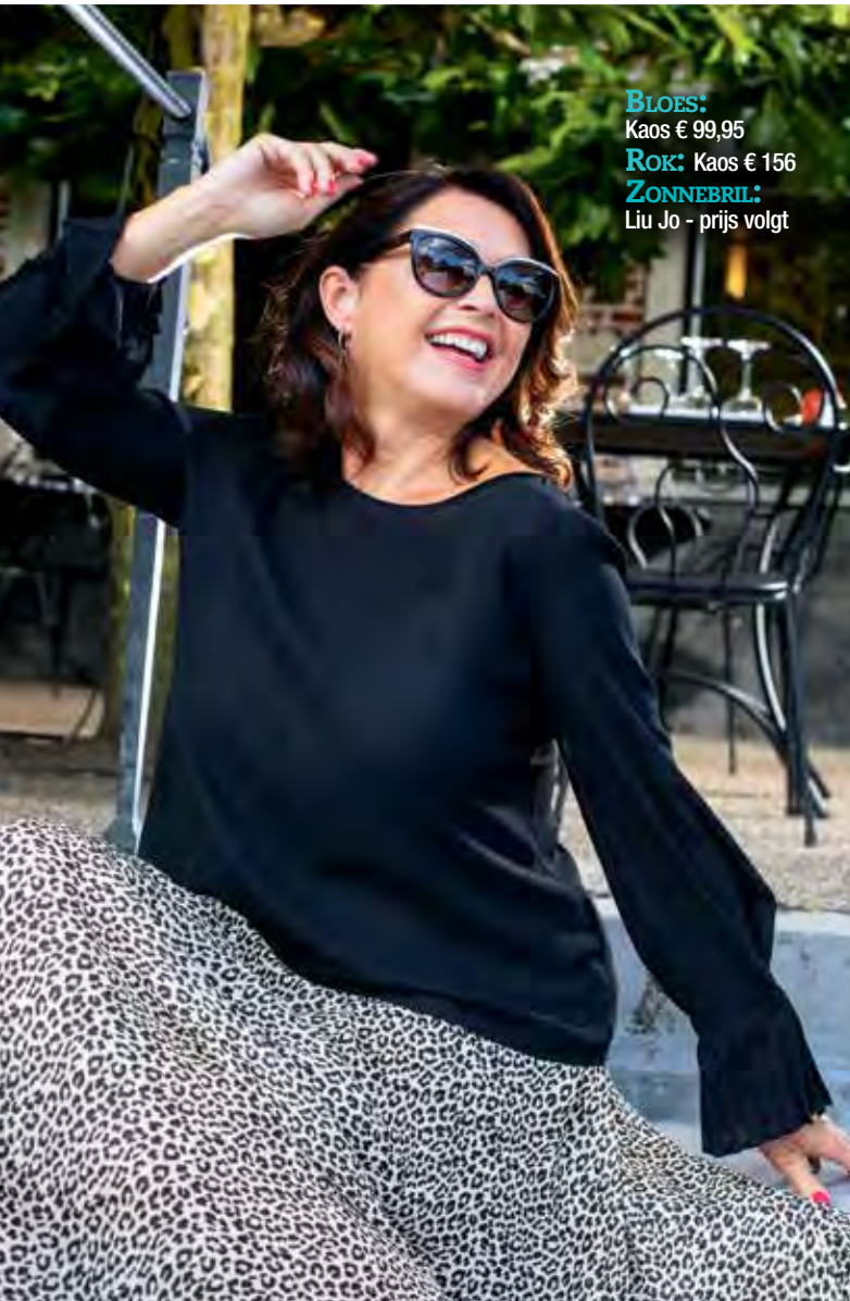
BLOES: Kaos € 99,95 ROK: Kaos € 156 ZONNEBRIL: Liu Jo - prijs volgt