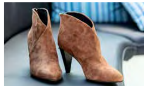
LAARZEN: : Lola Cruz € 195