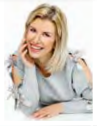
Door Ellen Van Driessche