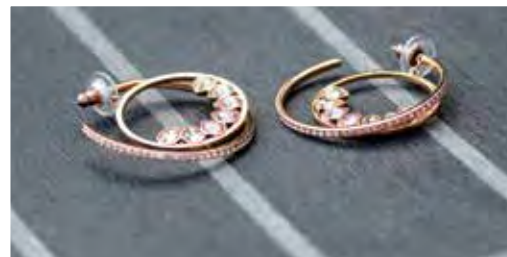
OORBELLEN: Swarovski € 149